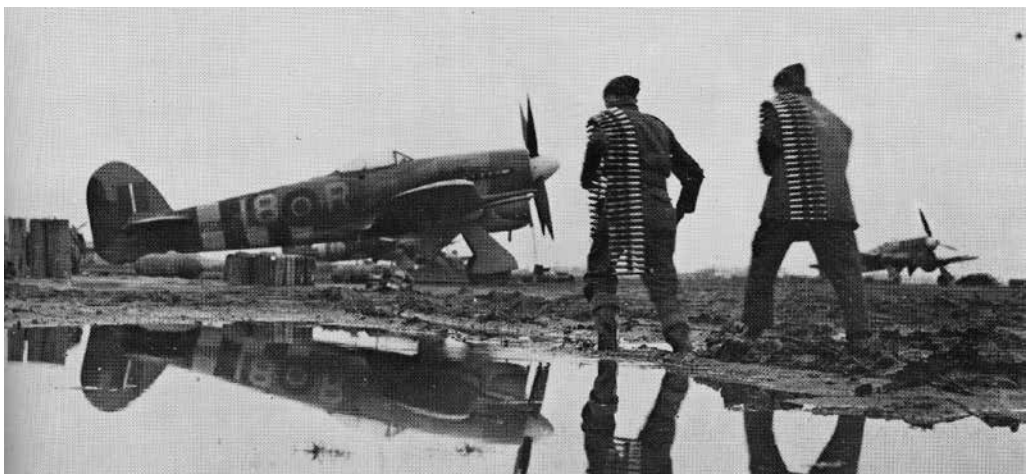
Twee bewapeningsmonteurs van No.440 Squadron RCAF ploeteren op een vliegbasis bij Eindhoven door de modder met munitie voor de 20mm boordkanonnen (Foto coll. Imperial War Museum, London).