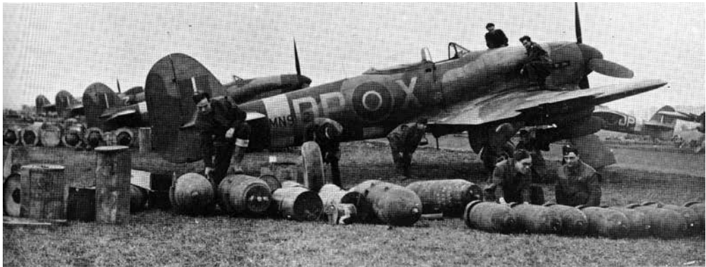
Herbewapening van de Typhoons door grondpersoneel. Op de voorgrond worden 500 lbs en 1.000 lbs bommen gereedgemaakt voor een nieuwe missie.

in het operatieverslag als uiterst succesvol omschreven omdat het wegenkruispunt was geblokkeerd. De gebouwen aan beide zijden van de hoofdweg stonden in brand. Tijdens de duikbombardementen op Montfort werd gebruik gemaakt van 1.000 lbs bommen en het is opvallend dat tijdens deze aanval een toestel was bewapend met twee 500 lbs bommen. Minder succesvol was de onfortuinlijke opstijg poging van een nieuwe piloot. Deze veroorzaakte op zijn eerste operationele vlucht een ongeluk omdat hij een taxiënd toestel voor een opstijgend vliegtuig had aangezien. Daarbij werd het andere toestel doormidden gesneden, maar gelukkig kon de piloot met slechts enkele krasjes uit het vliegtuig ontsnappen. Bij terugkeer van de missie ging de landing wel goed en om 14:25 uur waren de zes toestellen van No. 438 Squadron weer veilig aan de grond in Eindhoven. 16 Als laatste