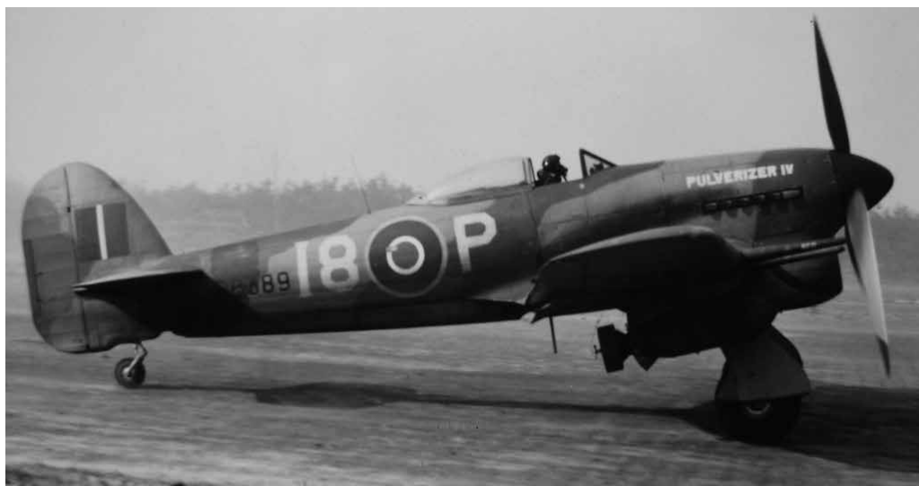
Een Hawker Typhoon 1B van het Canadese No. 440 Squadron op airstrip Eindhoven (Fotocollectie Imperial War Museum, London).