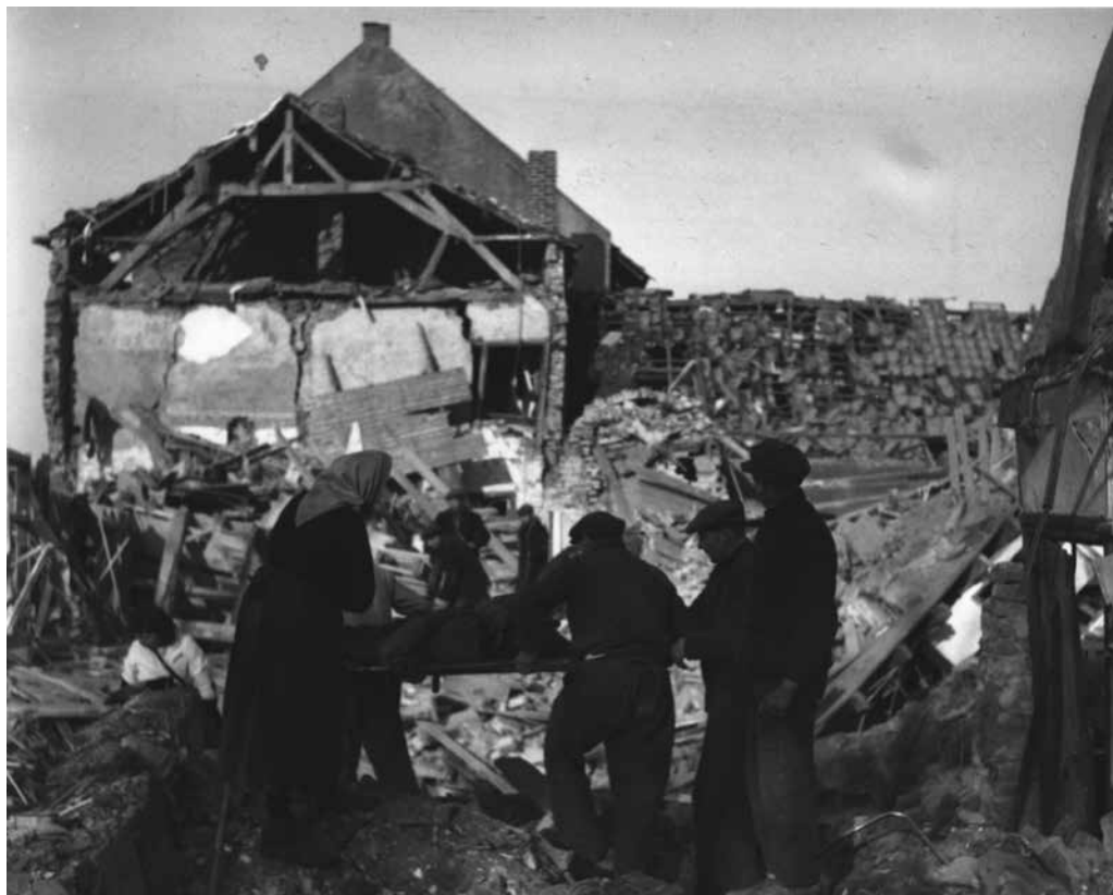
Op 24 januari 1945 kon er pas worden begonnen met het bergen van de burgerslachtoffers.

en met raketten bewapende Typhoons lijken hier meer op zijn plaats te zijn. Deze kunnen de doelen preciezer raken en zijn meer proportioneel dan 1.000 lbs bommen. Het is opvallend dat de oorzaak van de vele omgekomen burgers bij de vijand wordt gelegd omdat deze de schuilplaatsen van de burgerbevolking had ingenomen. Vervolgens werden de burgers de straat op gejaagd. Er zijn meerdere van deze gevallen bekend, vooral op de locaties waar is gevochten, zoals op de Waarderweg en de Linnerweg. 30 Maar het was beslist niet zo dat alle kelders door de Duitsers waren bezet. Daarbij zijn onder de burgerbevolking meer doden in de kelders gevallen dan buiten op straat. Er wordt in het rapport niet verteld dat overlevenden in de bedolven kelders door de aanhoudende Britse artilleriebeschietingen niet konden worden gered en dat het artillerievuur ook slachtoffers heeft geëist. De Canadese piloten hadden overigens tijdens de bombardementen geen bewegingen in het dorp gezien. Dit is ook niet zo vreemd, omdat tijdens een luchtaanval meestal dekking wordt gezocht. In het rapport wordt ook het bevolkingsaantal van 4000 mensen laag geschat. Het Civil Affairs detachement vermeldt dat er op 24 januari 5000 overlevenden in Montfort zijn. 31 Nederlandse bronnen zeggen dat er tussen de 7000 en 8000 personen in Montfort verbleven. 32